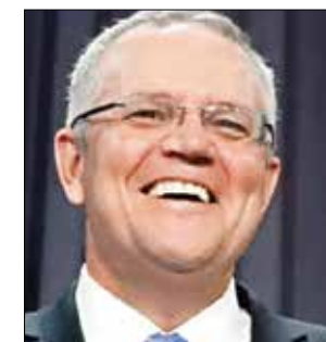
SCOTT MORRISON: Has last laugh

MELBOURNE: Polling companies in Australia are facing the heat after the forecast debacle, with data analysts putting the blame on unrepresentative samples, inability of pollsters to keep up with technology and inadequate monitoring of real-time sentiment on social media. Defying exit poll predictions, the ruling Liberal-National conservative coalition led by Prime Minister Scott Morrison claimed a shock victory in Saturday's general election. It was a stunning turnaround after every opinion poll over the campaign predicted a Labor Party victory. A Galaxy exit poll had put Labor Party led by Bill Shorten at 52 per cent of the vote compared to 48 per cent for the Liberal National coalition, according to Nine News. The Federal opinion poll aggregate BludgerTrack 2019 - which draws from NewsPoll, Galaxy, Ipsos, YouGov, Essential Research and ReachTEL polls - also had Labor at 51.7 per cent and the Coalition sitting at 48.3 per cent of the vote on a two-party preferred basis when it was last updated on Friday. In the wake of the Labor Party's shocking loss, many on social media have railed against the results, Australian news site news.com.au reported. Political scientist Dr Andy Marks, who said earlier in the campaign that a Labor victory was "virtually unquestionable" based on polling, told SBS News that the result shows how "worthless mainstream polling has become." "I think this is really a cataclysmic era of polling in this